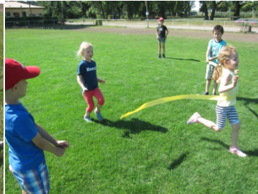
Zieleinlauf mit Band beim Sprint