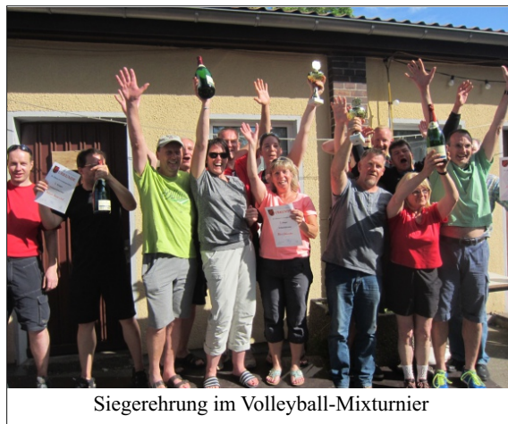
Siegerehrung im Volleyball-Mixturnier