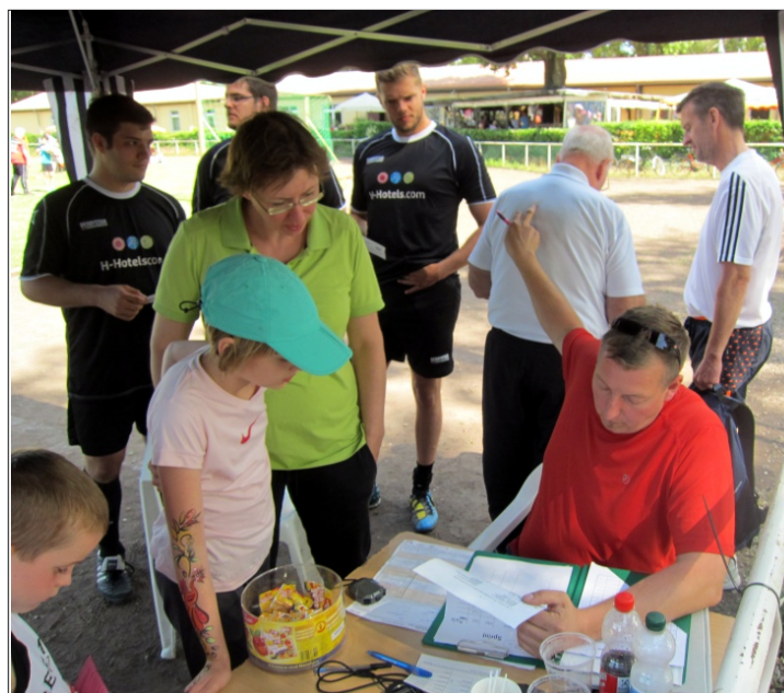
Immer viel Betrieb beim Kampfgericht Lauf