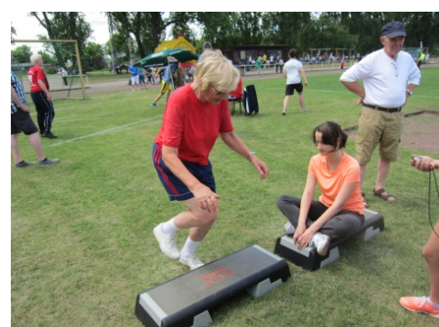
Kräftezehrende Station : Der Stepper