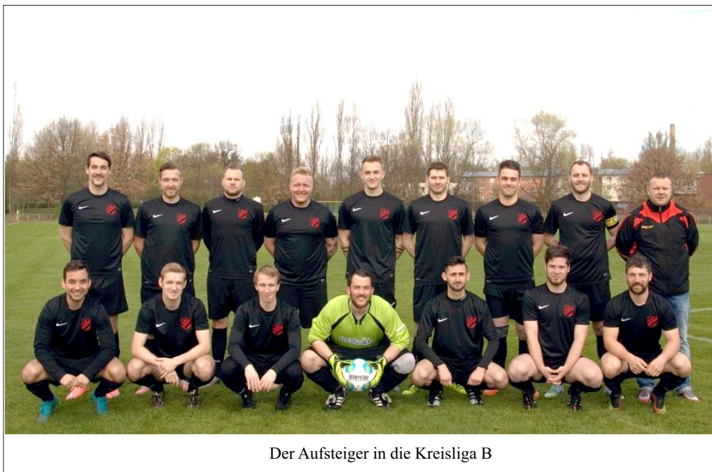
Der Aufsteiger in die Kreisliga B