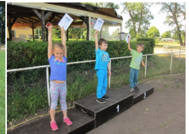
Jubel nach der Siegerehrung mit Urkunde und Lok-Aufkleber