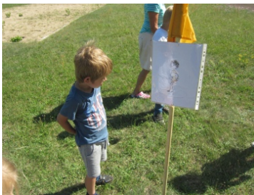
Rosis gezeichnete Männchens als Vorlage für die Übungsausführung