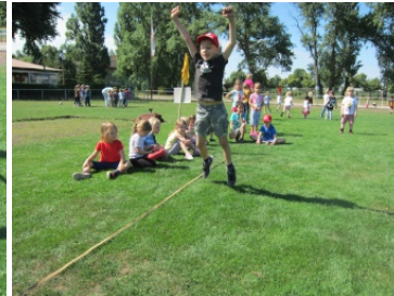
Schlusssprung Dreierhopp - die Wertungsdisziplin für die Siegerehrung