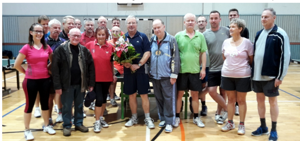
Der erfolgreiche TT-Trupp der vergangenen Saison