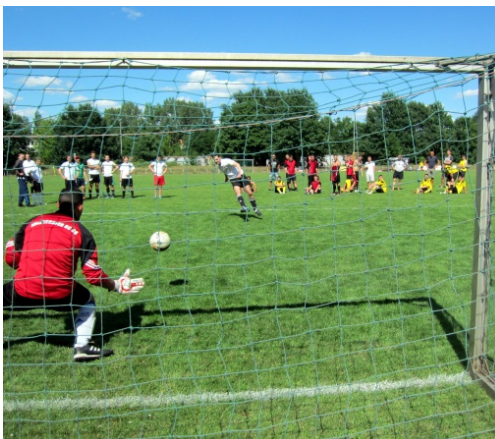
Wie so oft beim Fußball-Turnier: Entscheidung durch 7-Meter-Schießen

An allen Sportstationen, in allen Altersklassen der weiblichen und männlichen Teilnehmer wurden insgesamt 163 Sieger ermittelt. Nur im Fußball, Volleyball, Kegeln und Sportschießen wurden die ersten bis dritten Plätze mit Urkunden bedacht. Von allen Stationen sind die Sieger in dieser Zeitung auf den Seiten 10 bis 12 genannt. Noch einmal möchten wir allen 160 Erfolgreichen ganz herzlich gratulieren