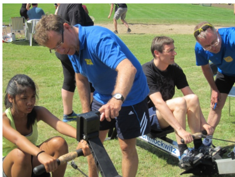
Die Ruderergometer des ESV Schmöckwitz waren wegen der Sachkunde der Betreuer sehr gefragt