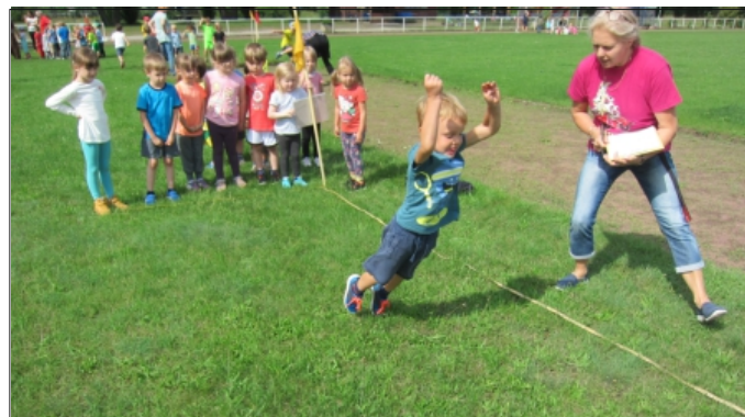
Die Wertungsdisziplin für die Siegerehrung: Dreierhopp im Schlusssprung