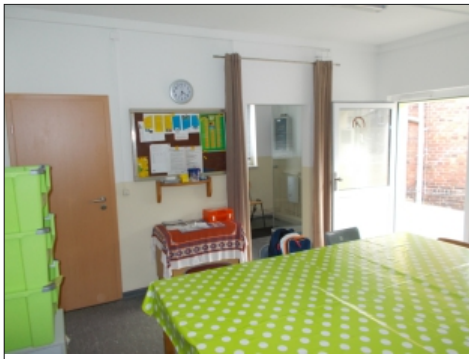
So sieht es in unserem neuen TROL aus