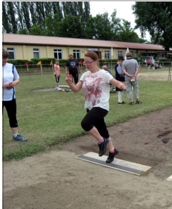
Weitsprung zählte auch für das Sportabzeichen