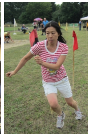
Schlängellauf, der beliebteste Sportfestwettbewerb