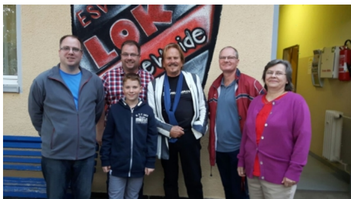
Mitglieder der Abt. Fußball mit Frank Zander