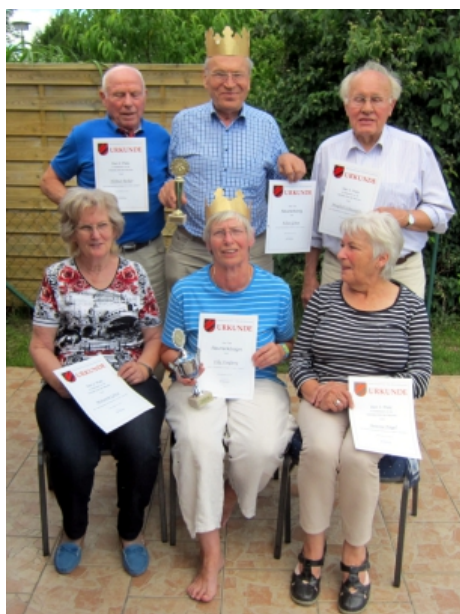
Die Königsfamilie: li. neben den Königen die Zweit-, re. die Drittplatzierten

Nach einem chinesisches Essen wurden zunächst die Sieger des Sommerkegeltorniers geehrt. Danach wurde die "Ratte des Halbjahres" vergeben. Der Höhepunkt - wie in jedem Halbjahr - ist die Huldigung der Neuerkönige, denen die Wanderpokale verliehen werden und die mit einer goldenen Krone zum Fotoshooting gebeten wurden.