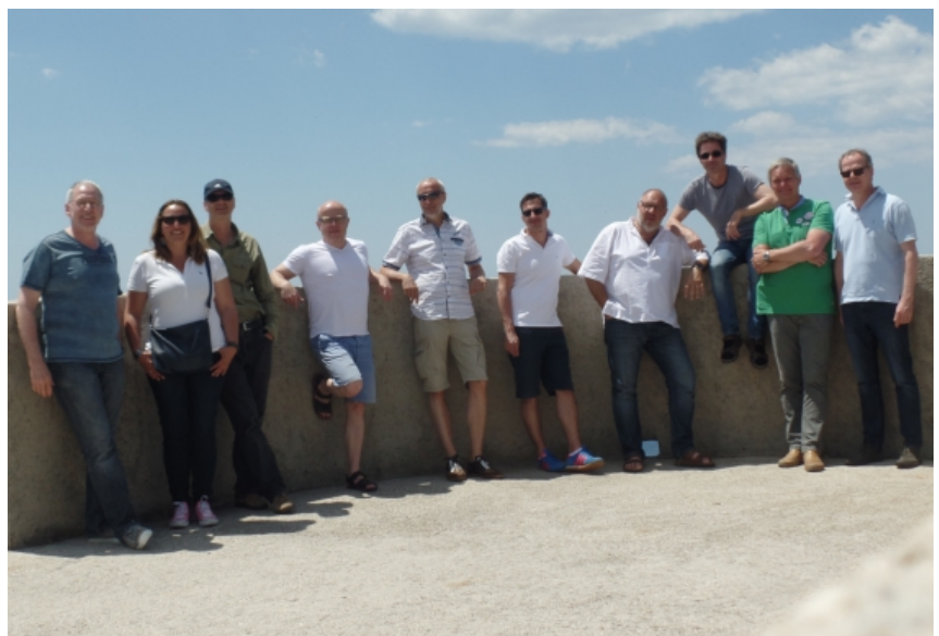
Die Wasserballer des ESV mit Fremdenführerin auf der Stadtmauer von Dubrovnik

Mannschaft freut sich schon auf die Herrentagsreise 2018 und bedankt sich bei allen, die zum guten Gelingen beigetragen haben.