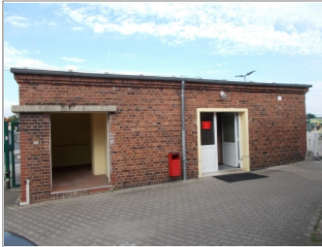
Das ehemalige Pförtnerhäuschen ist jetzt das neue OL-Domizil

Im Zuge des Ausbaus der Strecke Berlin – Frankfurt (Oder) wird bei den Umbauten des Bahnhofsgebäudes unser bisher genutzter Raum abgerissen, um den für die Gleisanlagen und Lärmschutzmaßnahmen notwendigen Platz zu schaffen. Nach einigen Aufschüben der Baumaßnahmen kam die Kündigung des Raumes vor gut einem Jahr ins Haus. Von DB Stationen & Service konnte uns leider kein Ersatz angeboten werden. Es begann damit eine längere Suche nach einem Trainingsraum. Während Hanne Dirks Anfragen in Richtung der Bahndienststellen schickte, hat die Abteilung OL in Wilhelmshagen und Umgebung diverse Möglichkeiten untersucht. Das waren z.B. ortsansässige