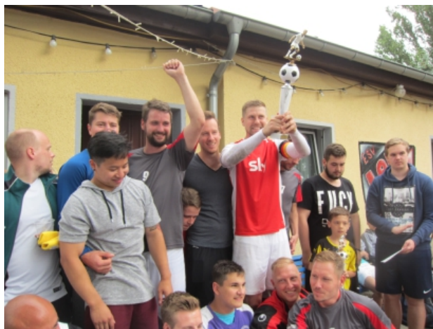
Fußball-Siegerehrung: The winner is "The Legends"

(S. 3 mehr zum Verlauf, S. 10, 11 und 12 alle Sieger des Sportfestes)