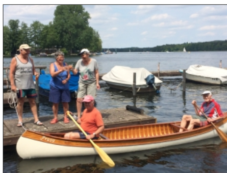
Die Bootstaufe den neuen /alten Canadiers "Peggy"

Der Canadier kann von zwei bis vier Kanuten mittels Stechpaddel gefahren werden. Ein mittig einsetzbaren Tisch erlaubt bei Wanderfahrten sogar Provianteinnahme, während zwei Sportler weiterpaddeln.