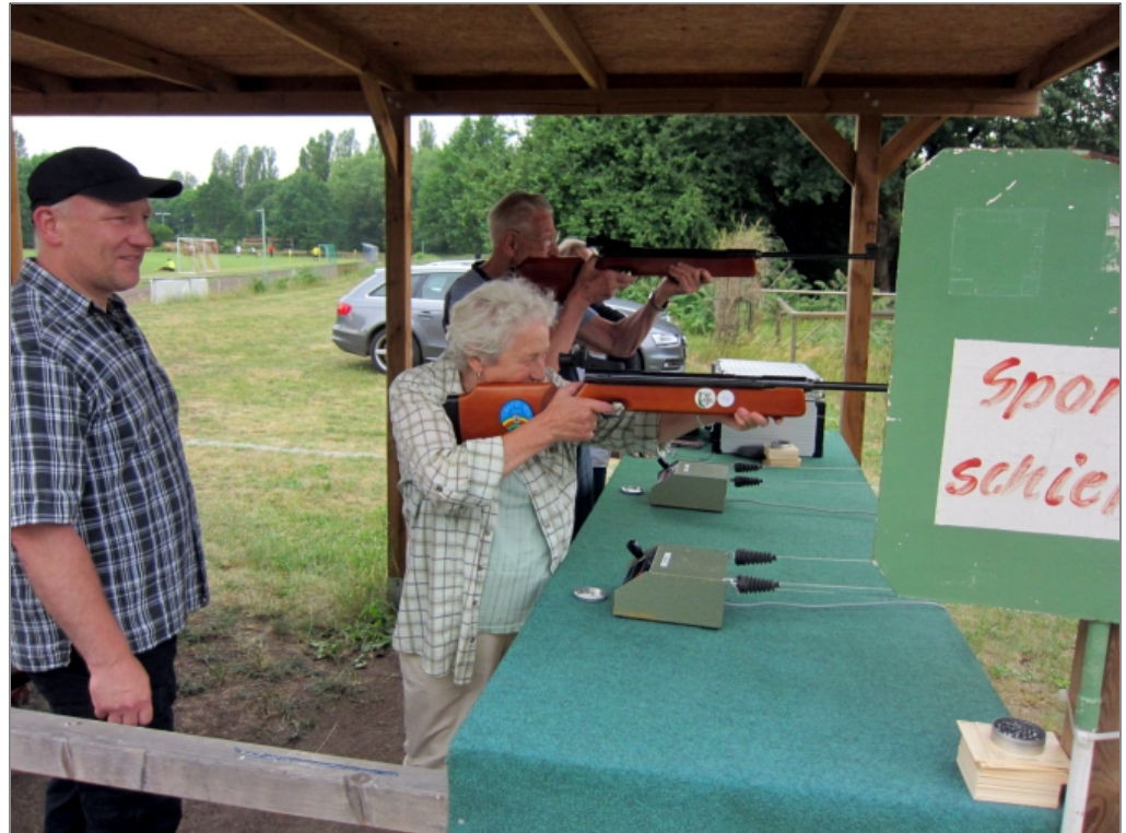
66 Schützen mit je 5 Schuss, viel zu tun für die Kampfrichter