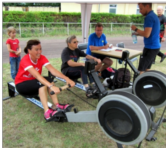
Gern geübt auf dem Ruderergometer