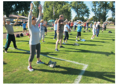
Alle Teilnehmer müssen über 60 sein. Oft staunen sie, was sie alles noch können.

Es ist der 16. Sport-Treff für Leute ab 60 Jahre auf dem Lok-Sportplatz am Betriebsbahnhof Schöneeweide (Adlergestell 105, 12439 Berlin).