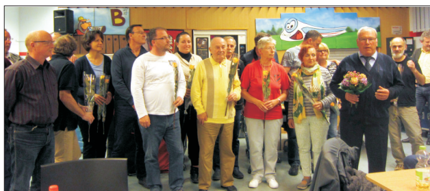
Nach der Wahl stellt sich der neue Vereinsvorstand mit Kassenprüfer und der Beschwerdekommision vor. Der 1. Vereinsvorsitzende bedankt sich bei den anwesenden Mitgliedern für das geschenkte Vertrauen.