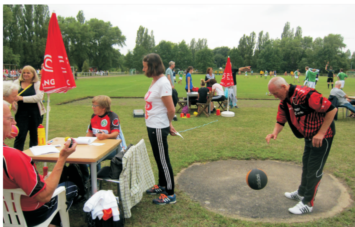
Ballprellen ist eine der Disziplinen mit vielen Teilnehmern

Ballwurf (Schlagball bis 11 Jahre, Wurfball 12 17 Jahre)