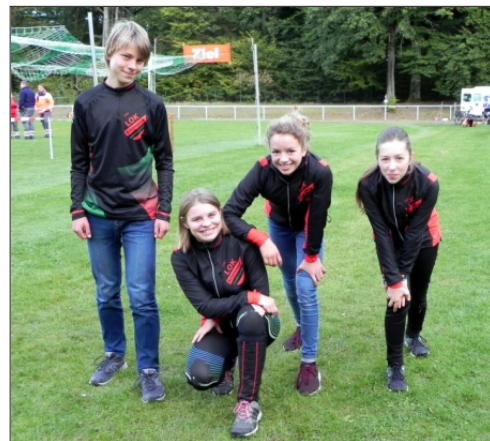
Die Jugendgruppe unserer Abt. Orientierungslauf startete auch bei den Deutschen Meisterschaften