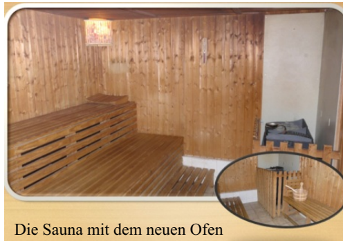
Die Sauna mit dem neuen Ofen

Wie auf dem Typenschild am Saunaofen zu erkennen war, hatte dieser über 30 Jahre seine Dienste geleistet. So entschlossen wir uns, mit dem Eigentümer der Sauna, der S-Bahn Berlin GmbH, in Verbindung zu treten. Wir bekamen das Angebot, einen neuen