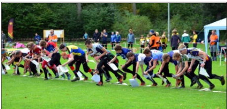
Der Start zum Staffellauf