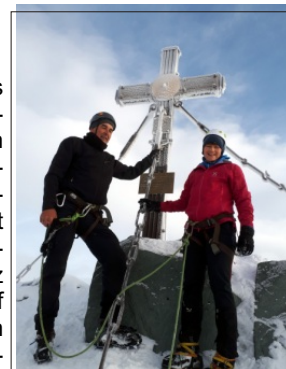
Am Gipfelkreuz des Großglockner