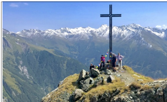
"Gipfeltreffen" auf der Blauspitze

So ging unsere erste Erkundungstour am nächsten Tag nur kurz über die Schneefallgrenze von 1.800m bis auf die auf 2.241m hoch gelegene Lucknerhütte.