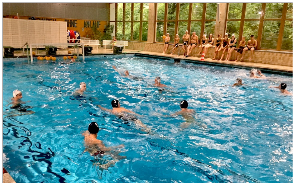
Der erste Wasserballvergleichskampf der Jugendmannschaft