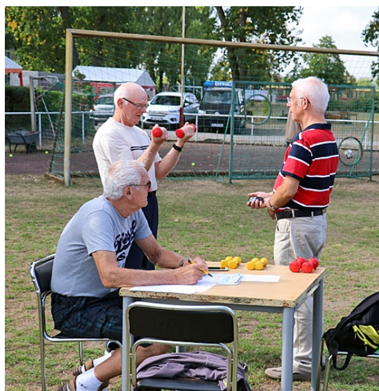
Die am meisten frequentierte Sportstation war die Hantelübung