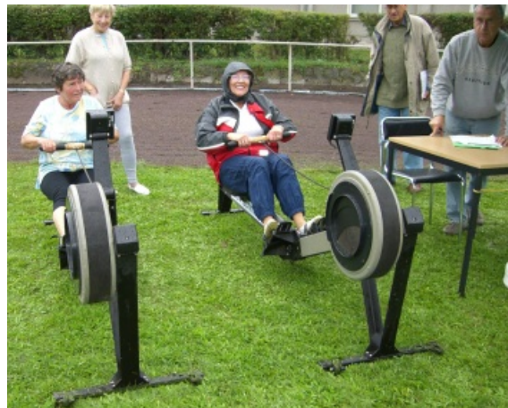
Diesmal war das Ergometer-Rudern wirklich eine Wassersportart beim Senioren-Sport-Treff.

Alle Sieger und die vielseitigsten Teilnehmer sind auf den Seiten 3 und 4 zu finden, ebenso die Sponsoren. Die Organisatoren freuten sich sehr über die vielen Dankesworte der Sport-Treff-Teilnehmer, denen es trotz des Regenwetters gut gefallen hat.