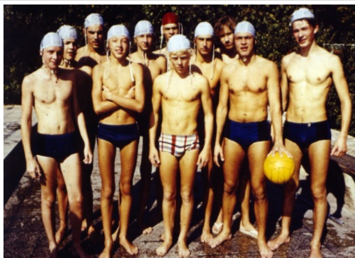
Eine unserer stärksten Jugendmannschaften war die des Jahrgangs 1976. Hier beim Pokalturnier in Leipzig.

1. Herrenmannschaft in der Berliner Verbandsliga.