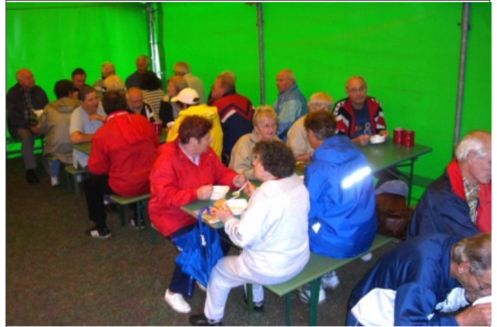
Alle hatten nicht Platz im Essenzelt, aber mit Beginn der Essenausgabe hörte auch der Regen auf.