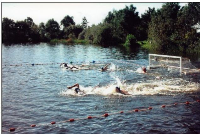
Fünf Spielfelder sind in einem Waldsee aufgebaut für das Turnier in Meppel (Niederlande) - 2003 war der ESV Pokalsieger bei einer Teilnahme von 32 Mannschaften.

1997/98 folgt der Aufstieg in die nächst höhere Spielklasse, die Verbandsliga. Natürlich gab es auch in diesen Jahren einige Tiefschläge, wenn Spieler aus beruflichen Gründen oder vielfältigen Freizeitangeboten nicht mehr oder nur sporadisch zum Training oder Spiel am Wochenende erschienen. Die