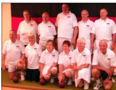
Die deutsche Mannschaft vor dem Länderkampf gegen Dänemark

Am zweiten Tag war ein Ausflug zur Fehmarnsundbrücke angesagt, der bei herrlichem Sonnenschein auch zum besonderen Erlebnis wurde und die gesamte Veranstaltung abrundete. Als neues Mitglied in der deutschen Auswahlmannschaft wurde ich sehr herzlich aufgenommen und konnte dieses mit meinem Kegelergebnis, dem 2. Platz bei den Damen,