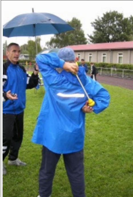
So ist es richtig: Der Klöppel wird über die Schulter in die andere Hand gelegt. Die Anzahl der Wiederholungen in 30 Sek. wurde gemessen.

Der „harte Kern“ war trotz des ausgesprochenen Sauwetters zum 14. Senioren-Sport-Treff gekommen, den der ESV Lok Schöneweide für alle ab 55 Jahre aus dem Bezirk Treptow-Köpenick organisierte. Genau 20 Männer und 30 Frauen, also 50 Aktive gingen an die Sportstationen, die zuvor von den Helfern vom ESV aufgebaut und dann auch betreut wurden. Einige Helfer kamen trotz der geringeren Teilnehmerzahl gegenüber den Vorjahren nicht dazu, selbst an die Stationen zu treten. So u. a. die Helfer vom Kegeln,