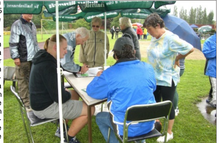
Gut beschirmt waren Kampfrichter und Aktive - hier half nur regendichte Kleidung. Trotzdem lief alles reibungslos.

schmecken. Und es schmeckte vorzüglich. Die Info-Stände von EuroMed und Pro Senior leisteten ihren Anteil zum Gelingen