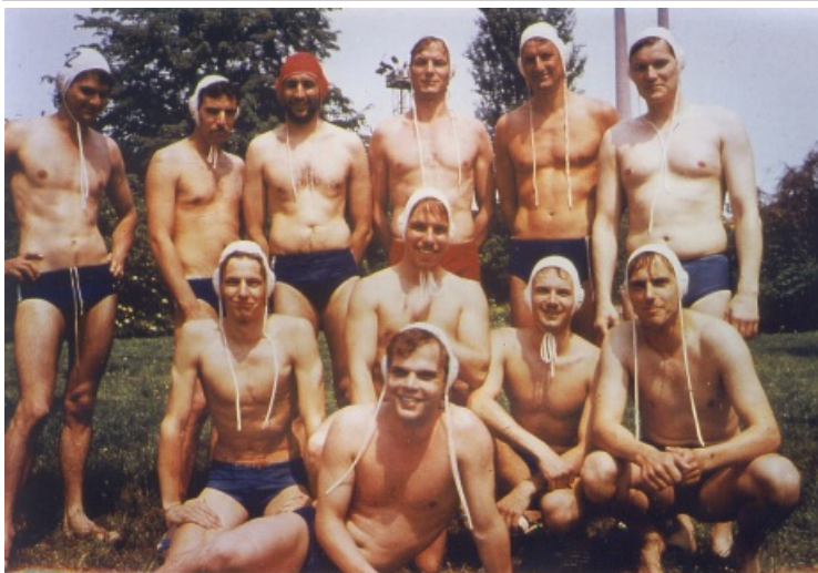
Eines der letzten Wasserballspiele unseres Teams vor der politischen Wende fand 1989 im Freibad Hettstedt statt. Hier vor einem DDR-Liga-Spiel.